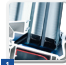
1 2- oder 3-fache Isolierverglasungen in verschiedenen Stärken

Auf den ersten Blick unterscheiden sich die Fenster vieler Anbieter kaum voneinander. Entscheidend für die Qualität sind jedoch die einzelnen Komponenten, die verwendet werden: