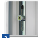
2 Beschläge für Funktion und Bedienung