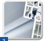
3 Profile für Rahmen, Flügel und andere Konstruktionselemente